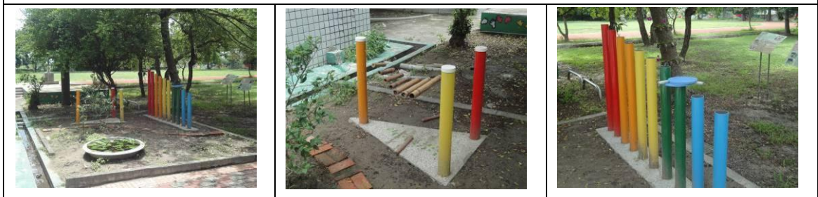
整建後之科學遊戲器材