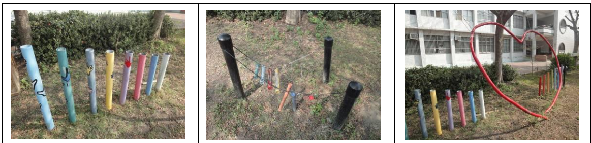
整建前之科學遊戲器材

本校科學遊戲區原設置六座聲音遊戲器材（千手運球、蝴蝶傳聲筒、竹管琴、豎管共振琴兩座、心心相印），原為塑膠管直接埋入土中建置，但因已建置多年，目前呈現歪斜倒塌之情形。欲整建成為水泥地樁底座，以便透過活動的進行，讓孩子從遊戲中習得相關科學原理。